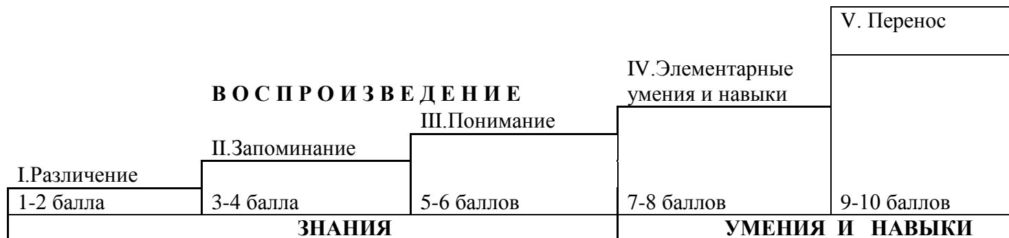
Рис 2. Модель обученности любого человека

Графическое изображение этапов оценки степени обученности обучающихся, в рамках десятибалльной интерпретации пяти последовательных показателей когнитивного процесса.